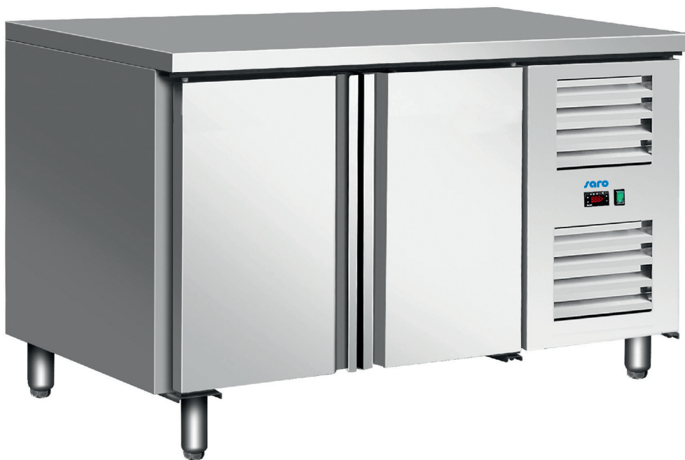
KYLJA 2100 TN